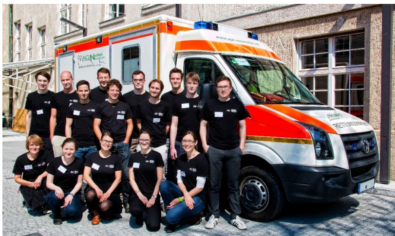
(Fast) das ganze Team der Arbeitsgemeinschaft Notfallmedizin München

Wir möchten Medizinstudierenden bereits ab dem ersten Semester einen Zugang zur Notfallmedizin gewähren und bieten daher über das reguläre Curriculum hinaus freiwillige Theorie- und Praxiskurse, eine Austauschplattform für notfallmedizinisch interessierte Studierende an und laden zu Fachvorträgen von erfahrenen Notfallmedizinern ein.